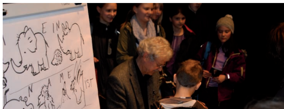
Paul Maar beim Signieren für die Schüler des Evangelischen Schulzentrums